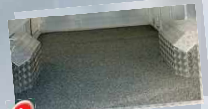
6 Cibélastic graviers