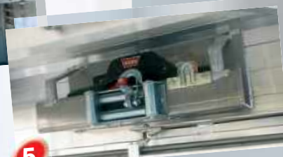
5 Treuil WARN Zéon 8