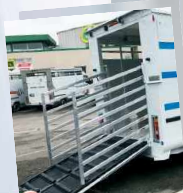
9 Barrières anglaises