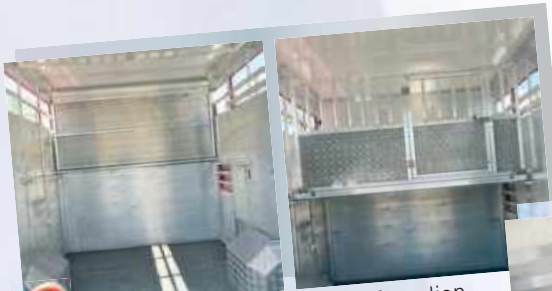
4 Etage 1.60 m repliable avec séparation arrière relevable