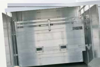
1 Séparation aluminium