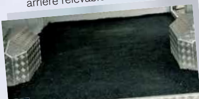
7 Cibélastic chevaux