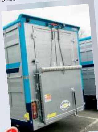
8 Portes AR + pont 1.20 m