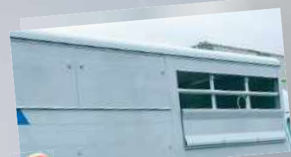
10 Fermeture claires-voies avec volets