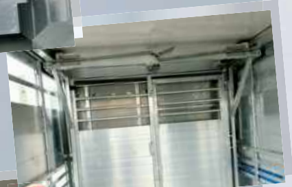
2 Cloison coulissante avec portillon